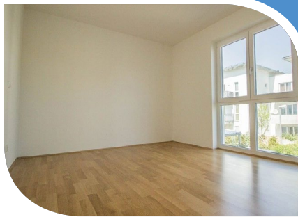
Beispiel eines Schlafzimmers. Bodentiefe Fenster, bringen viel Licht in die Räume.