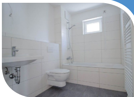
Beispiel eines Badezimmers, mit Fenster und Wandheizkörper, Badewanne, Waschbecken und Toilette in Standardausführung.